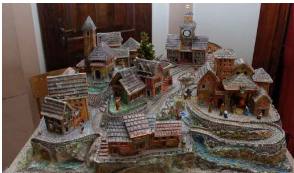
Sopra: Presepe in miniatura, opera dell'amico Leo Rondelli