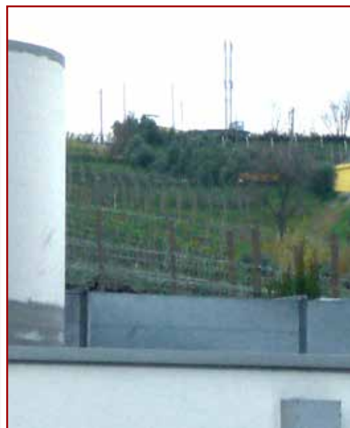
Foto scattata dalle Scuole di Falciano in direzione del traliccio

SU QUESTO TRALICCIO SONO STATE MONTATE DELLE ANTENNE A RADIO FREQUENZA CHE ANDRANNO A SOSTITUIRE QUELLE CHE ERANO MONTATE SULLA PRIMA TORRE IN CITTA'. QUESTE ANTENNE SERVIRANNO PER FORMARE UN SISTEMA COSIDETTO "TETRA" CHE VERRA' UTILIZZATO DALLA GENDARMERIA, DALLA POLIZIA E DALLA PROTEZIONE CIVILE.