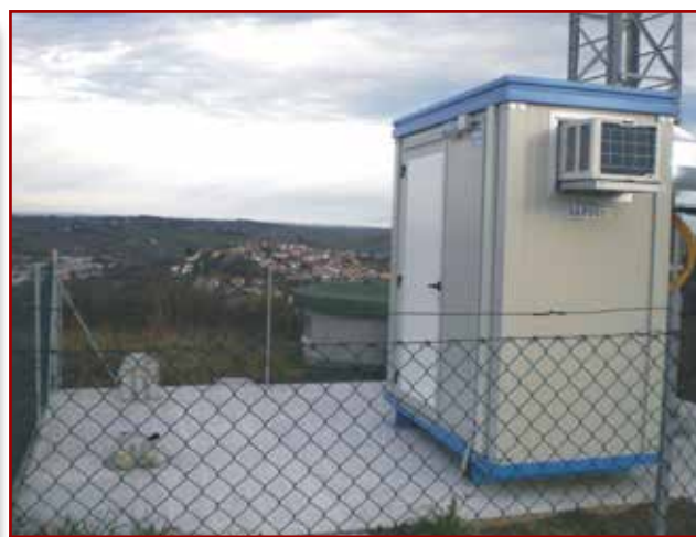
Container sotto il traliccio e vista di Falciano (zona Chiesa)